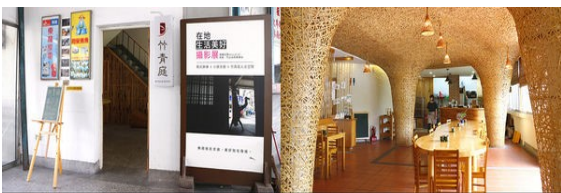
南投竹山特色餐廳·竹青庭人文空間